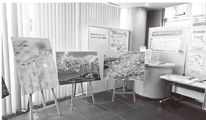
◀イナガキ ヤストさん(射水市出身、在住の写真家)の院内の写真展: きれいな射水市の写真たち