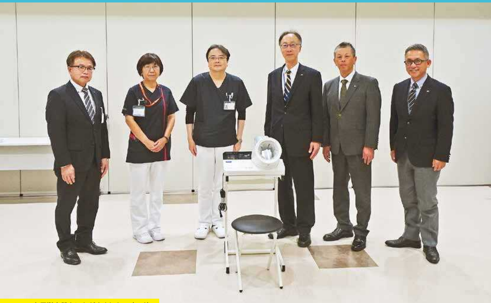
血圧測定器をいただきました (p.4)